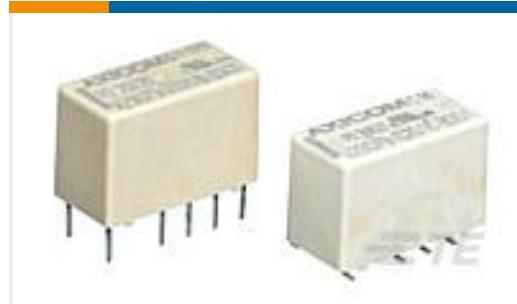
TE 产品编号7-1393788-1 V23079E1208B301