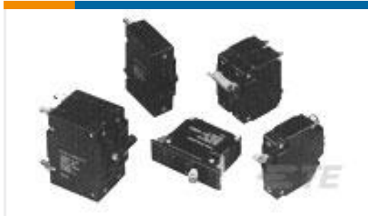
TE 产品编号1393255-8 W93-X112-30=M6/M7/M9/W6/W7