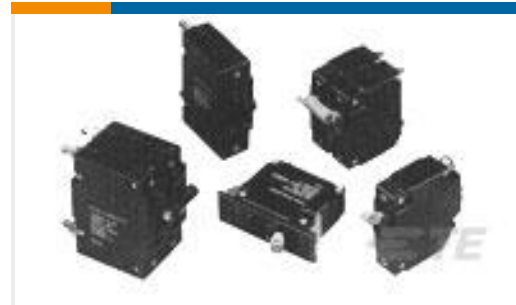
TE 产品编号7-1393254-7 W92-X112-30=M6/M7/M9/W6/W7