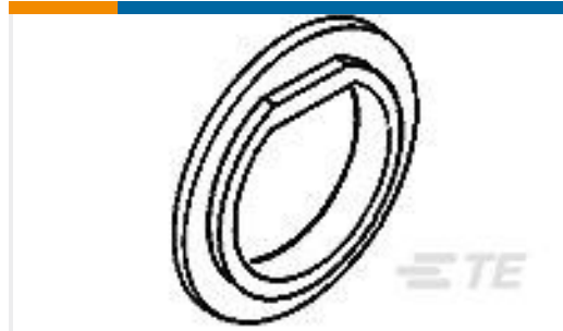
TE 产品编号222163-1 BUSHING INSULATING