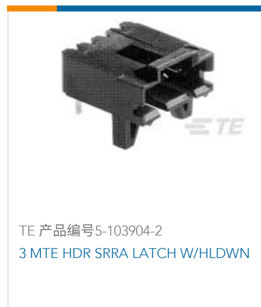
TE 产品编号5-103904-2 3 MTE HDR SRRA LATCH W/HLDWN