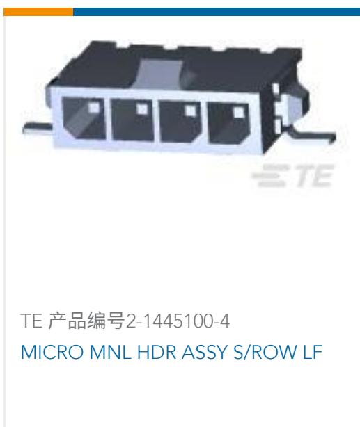
TE 产品编号2-1445100-4 MICRO MNL HDR ASSY S/ROW LF