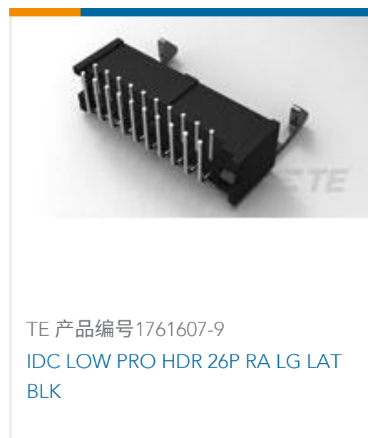
TE 产品编号1761607-9 IDC LOW PRO HDR 26P RA LG LAT BLK