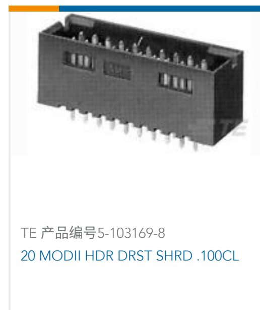
TE 产品编号5-103169-8 20 MODII HDR DRST SHRD .100CL BLK