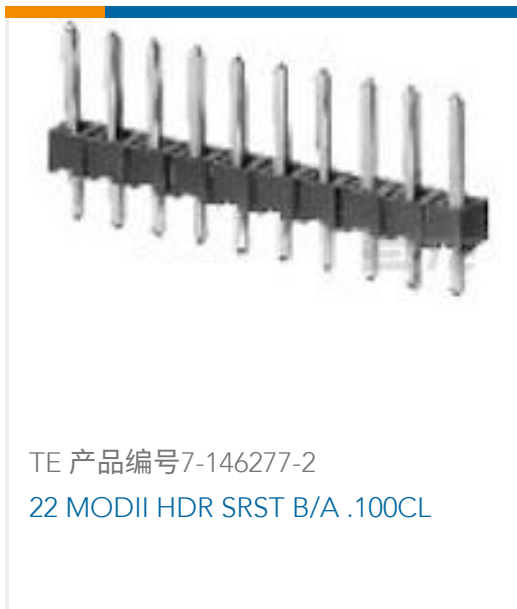
TE 产品编号7-146277-2 22 MODII HDR SRST B/A .100CL