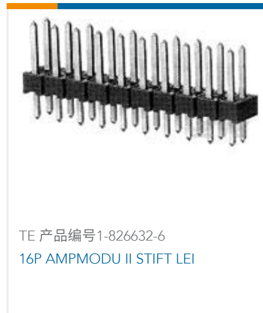
TE 产品编号1-826632-6 16P AMPMODU II STIFT LEI