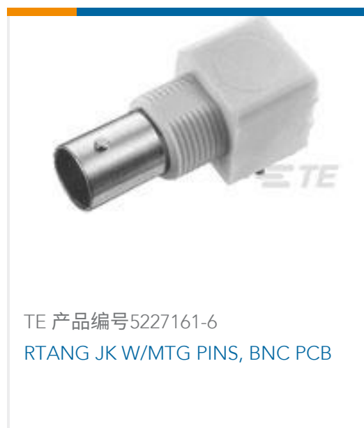
TE 产品编号5227161-6 RTANG JK W/MTG PINS, BNC PCB