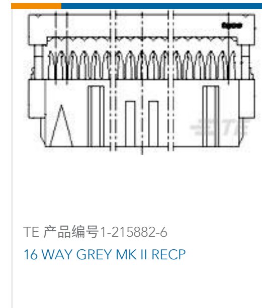
TE 产品编号1-215882-6 16 WAY GREY MK II RECP