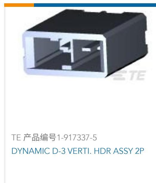
TE 产品编号1-917337-5 DYNAMIC D-3 VERTI. HDR ASSY 2P