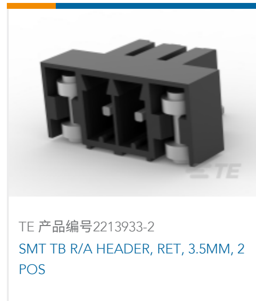
TE 产品编号2213933-2 SMT TB R/A HEADER, RET, 3.5MM, 2 POS