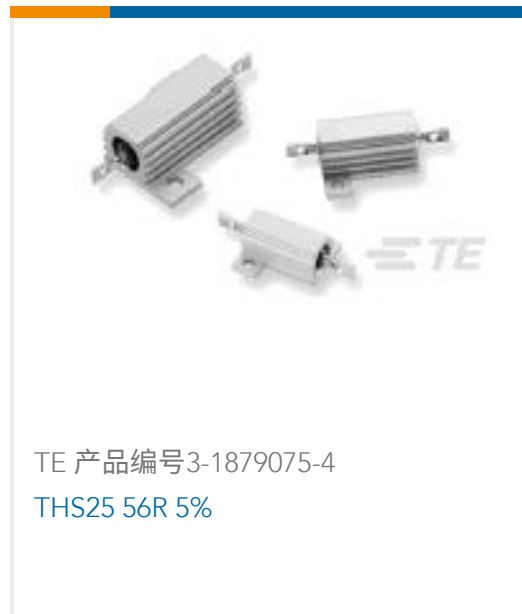
TE 产品编号3-1879075-4 THS25 56R 5%