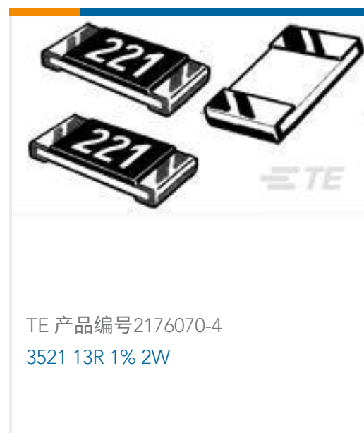
TE 产品编号2176070-4 3521 13R 1% 2W