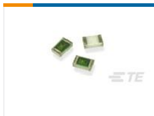
TE 产品编号6-1879127-7 RN 0402 422R 0.1% 10PPM CUT LENGTH