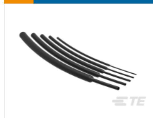
TE 产品编号E05774-000 VERSAFIT-1/4-0-25MM