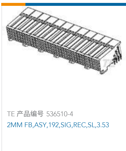
TE 产品编号 536510-4 2MM FB,ASY,192,SIG,REC,SL,3.53