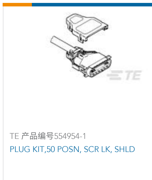
TE 产品编号 554954-1 PLUG KIT,50 POSN, SCR LK, SHLD