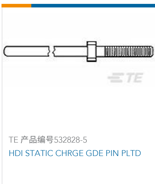
TE 产品编号 532828-5 HDI STATIC CHRG GDE PIN PLTD