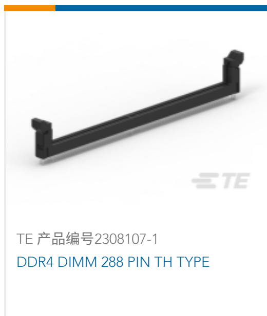
TE 产品编号 2308107-1 DDR4 DIMM 288 PIN TH TYPE