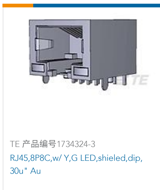
TE 产品编号 1734324-3 RJ45,8P8C,w/ Y,G LED,shieled,dip, 30u" Au