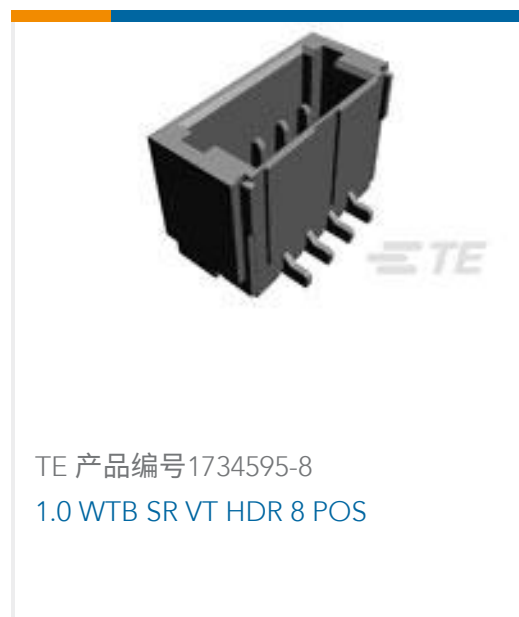
TE 产品编号 1734595-8 1.0 WTB SR VT HDR 8 POS