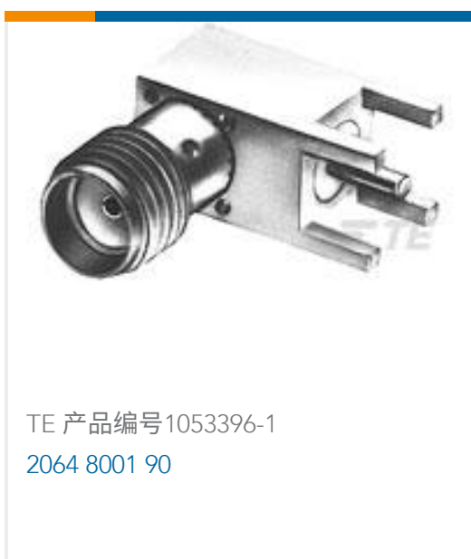
TE 产品编号 1053396-1 2064 8001 90