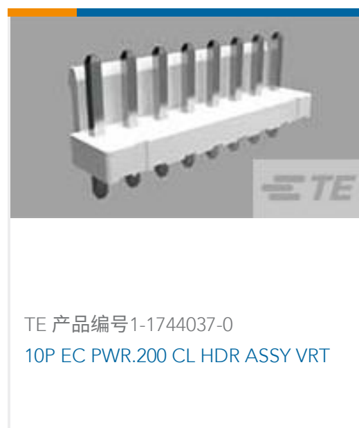
TE 产品编号 1-1744037-0 10P EC PWR.200 CL HDR ASSY VRT