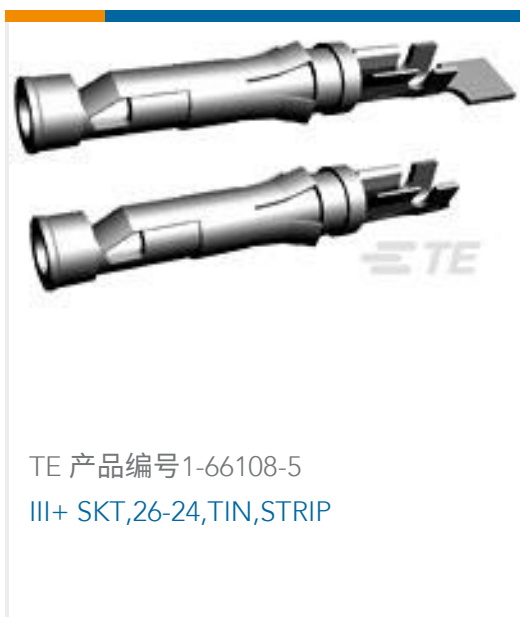
TE 产品编号 1-66108-5 III+ SKT,26-24,TIN,STRIP