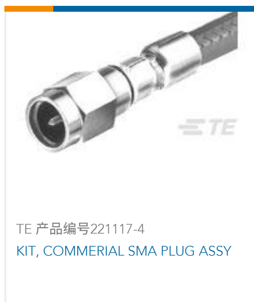
TE 产品编号 221117-4 KIT, COMMERCIAL SMA PLUG ASSY