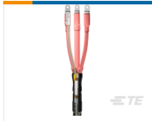
TE 产品编号A31452-070 GUST-12/70-120/800-L12