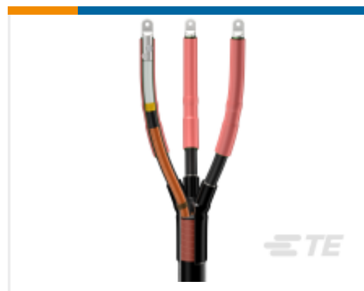
TE 产品编号E92435-063 POLT-12D/3XIH1