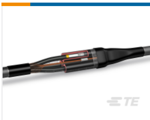
TE 产品编号A69078-064 POLJ-12/3X70-150