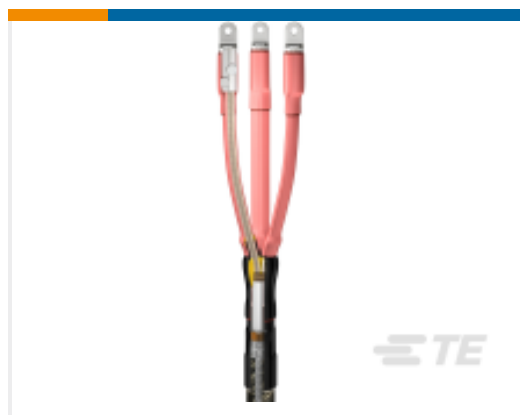
TE 产品编号C47372-064 GUST-12/25-50/800