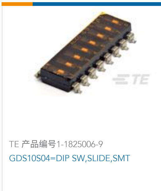
TE 产品编号1-1825006-9 GDS10S04=DIP SW,SLIDE,SMT