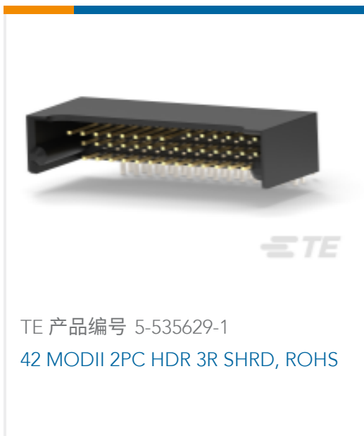
TE 产品编号 5-535629-1 42 MODII 2PC HDR 3R SHRD, ROHS