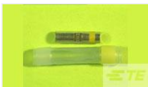
TE 产品编号 650075-000 D-436-37