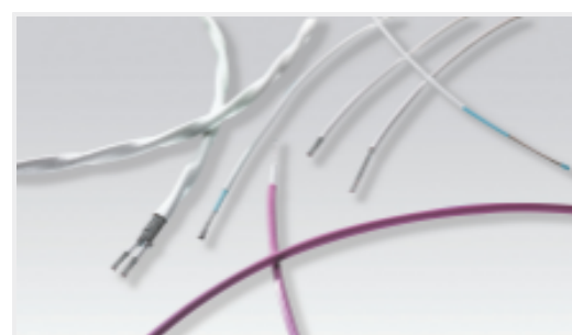
TE 产品编号618839-000 55PC1111-22-9-9CS2502