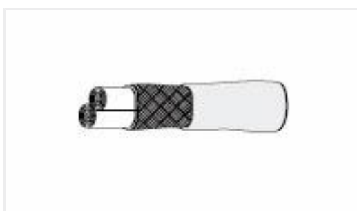
TE 产品编号340037-000 55PC1124-24-2/6-9CS2502