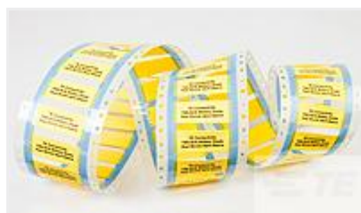
TE 产品编号9422810001 TMS-SCE-3/8-2.0-9