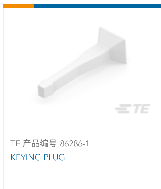
TE 产品编号 86286-1 KEYING PLUG