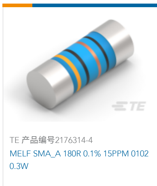
TE 产品编号2176314-4 MELF SMA_A 180R 0.1% 15PPM 0102 0.3W