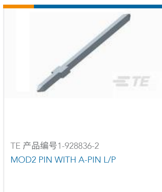
TE 产品编号1-928836-2 MOD2 PIN WITH A-PIN L/P