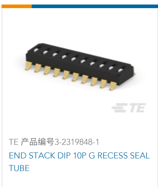
TE 产品编号3-2319848-1 END STACK DIP 10P G RECESS SEAL TUBE