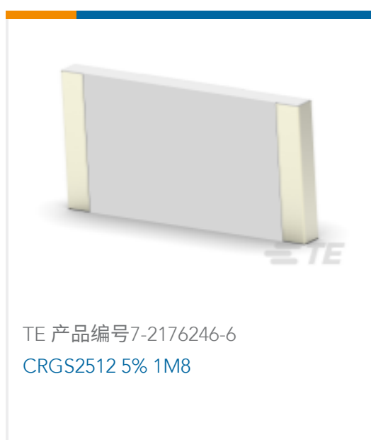
TE 产品编号7-2176246-6 CRGS2512 5% 1M8