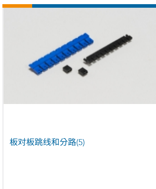
板对板跳线和分路(5)