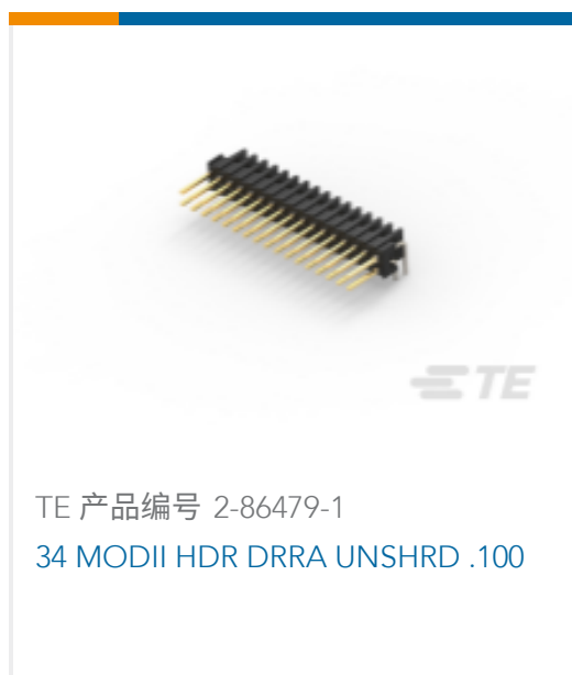
TE 产品编号 2-86479-1 34 MODII HDR DRRA UNSHRD .100