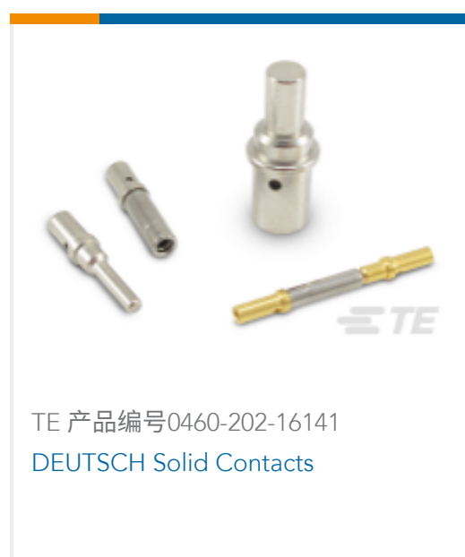
TE 产品编号0460-202-16141 DEUTSCH Solid Contacts