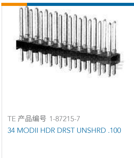
TE 产品编号 1-87215-7 34 MODII HDR DRST UNSHRD .100