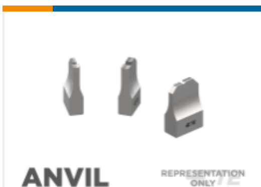
TE 产品编号3-1633923-7 ANVIL, COMBINATION