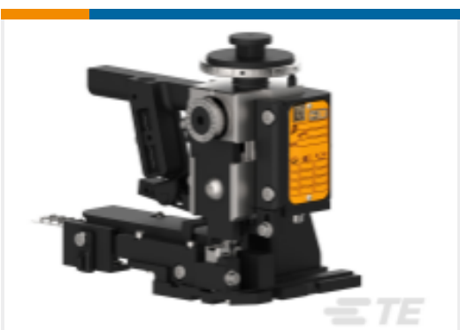
TE 产品编号2836704-1 OCEAN_2.0_Applicator-S-110F140OV