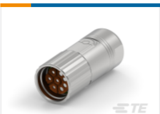
TE 产品编号BSA108N00590236000 923 PLUG, SHORT