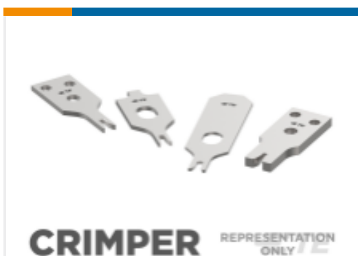
TE 产品编号5-1633996-9 CRIMPER, INSULATION SPECIAL