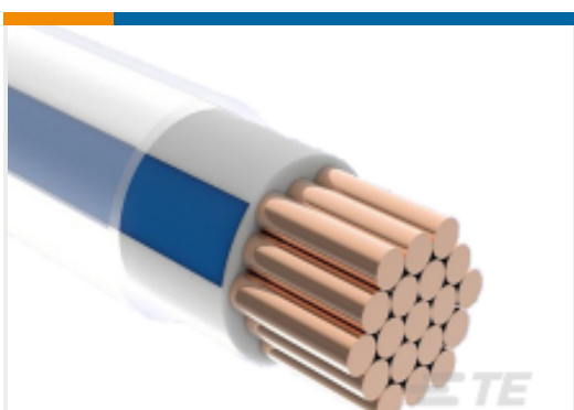
TE 产品编号CD06543001 ACW0219-1.50-60(NS)