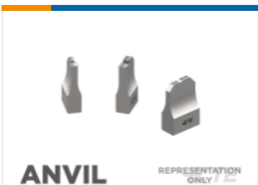
TE 产品编号1803060-4 ANVIL, COMBINATION, END FEED