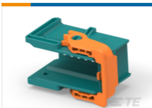
TE 产品编号1-2141847-4 CARRIER,RECEPTACLE HSG, 36POS, ASSY