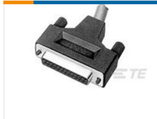
TE 产品编号1-747947-5 KIT, RCPT, 25P, HDE, SHLD ENCLSR