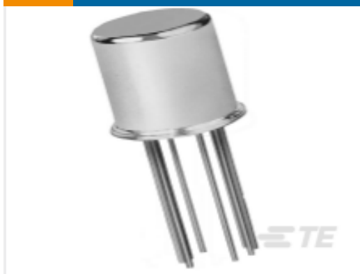
TE 产品编号1617127-8 JMSC-26XM = M39016/11-036M