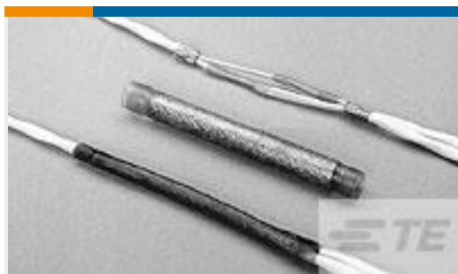
TE 产品编号CM0967-000 D-150-0348