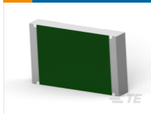
TE 产品编号2176402-5 3540 560R 5%