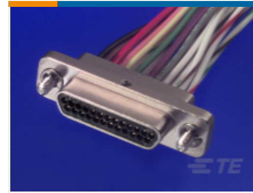
TE 产品编号1-1532174-1 M83513/04-D15N, MCKS-N1-B- 25S6Q1-72.0