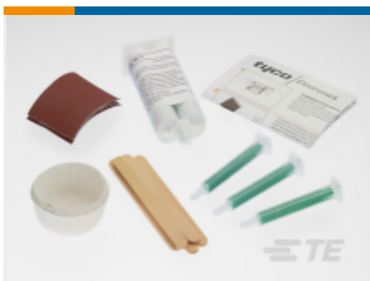
TE 产品编号 657863-000 S1125-KIT-8