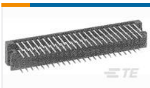
TE 产品编号 5-534974-3 72 MODII HORZ 2PC 3R CE 100CL, RoHS