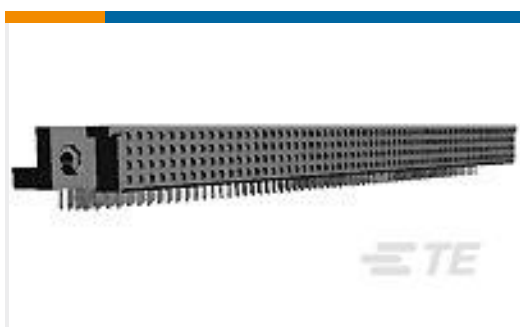
TE 产品编号5532434-9 ASSY,RECP,T,ANGLE,HDI,LEAD-FR