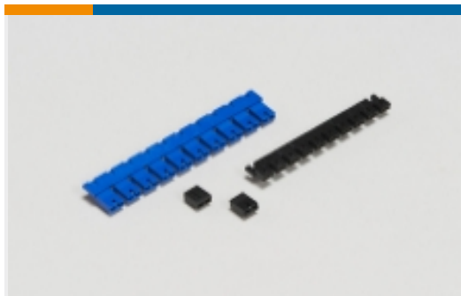
板对板跳线和分路(5)