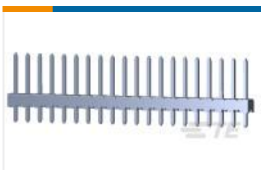
TE 产品编号5-644456-0 20P MTA100 HDR ASSY (NARROW)