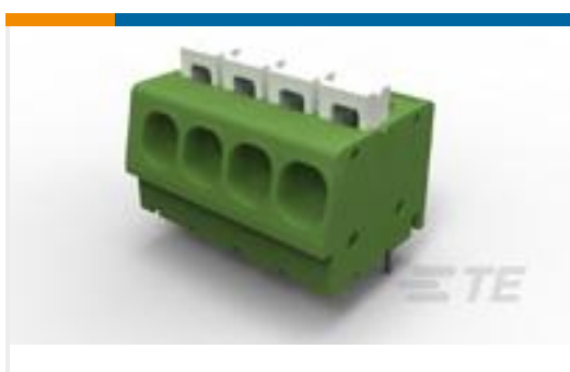
TE 产品编号1-1986711-5 SCREWLESS, SW,15P,5.0 PCB