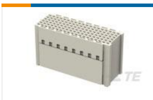
TE 产品编号1-2102061-1 Mezalog, Socket, 114 p, 18 mm, 30 Au, TL