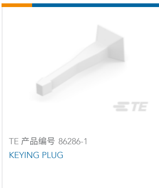
TE 产品编号 86286-1 KEYING PLUG