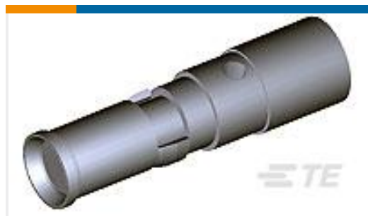
TE 产品编号212008-1 CONTACT, SKT, PWR 8