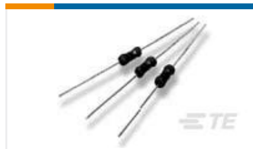
TE 产品编号1-1625892-6 3W SM M/OX 5% 15K