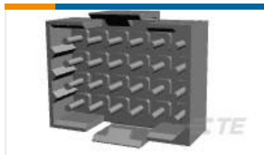
TE 产品编号1-206763-4 METRIMATE PIN HDR ASSY, 24P LF