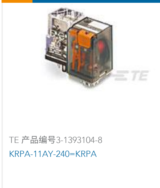
TE 产品编号3-1393104-8 KRPA-11AY-240=KRPA