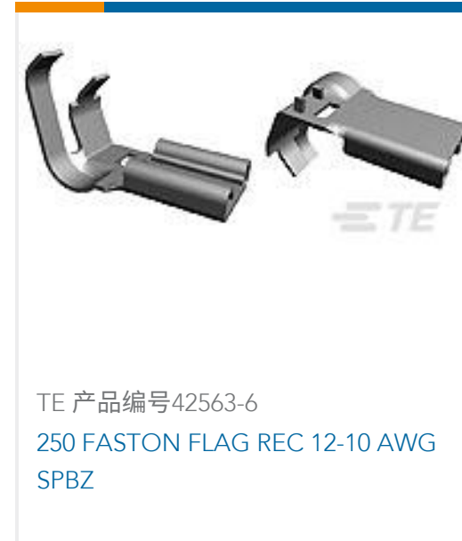
TE 产品编号42563-6 250 FASTON FLAG REC 12-10 AWG SPBZ