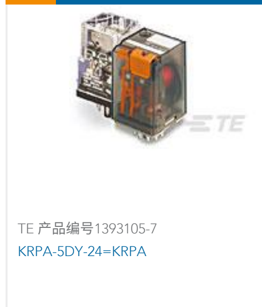
TE 产品编号1393105-7 KRPA-5DY-24=KRPA