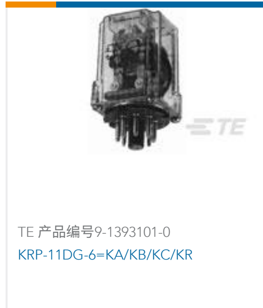
TE 产品编号9-1393101-0 KRP-11DG-6=KA/KB/KC/KR