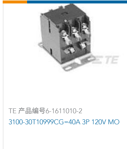
TE 产品编号6-1611010-2 3100-30T10999CG=40A 3P 120V MO