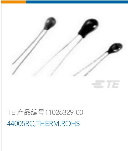
TE 产品编号11026329-00 44005RC, THERM, ROHS