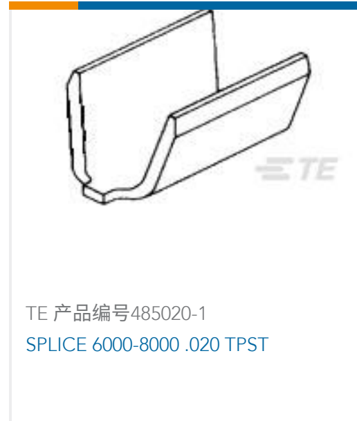
TE 产品编号485020-1 SPLICE 6000-8000 .020 TPST