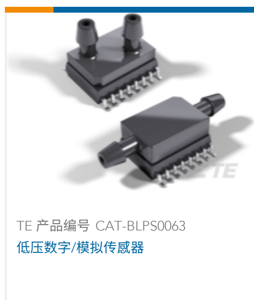
TE 产品编号 CAT-BLPS0063 低压数字/模拟传感器