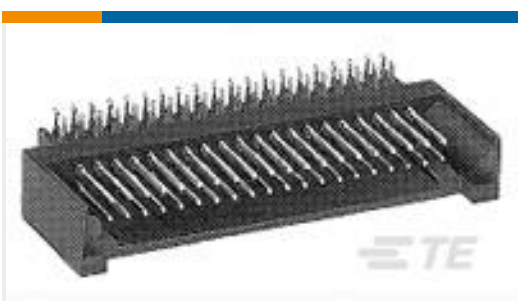
TE 产品编号 102589-7 60 MODII 2PC HDR DRRA SHRD