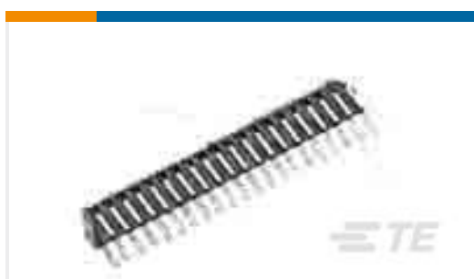
TE 产品编号104985-1 04 MODIV DR CE/TE .100 W/POL