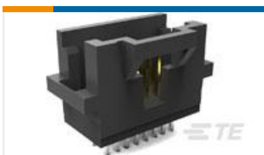
TE 产品编号104068-8 12 SYSTEM 50 HDR DRST SHRD