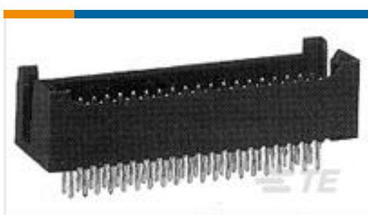
TE 产品编号 1-102567-2 40 MODII 2PC HDR DR SHRD .100