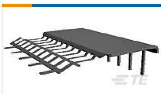
TE 产品编号5338110-9 Z-PACK SHLD.LOWER B