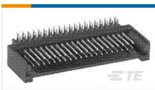
TE 产品编号 1-102589-3 40 MODII 2PC HDR DRRA SHRD