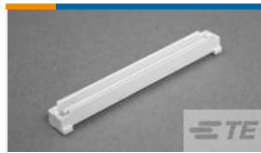
TE 产品编号5-5177986-1 0.8FH,P05H.5,040,30/Sn,TR,SC