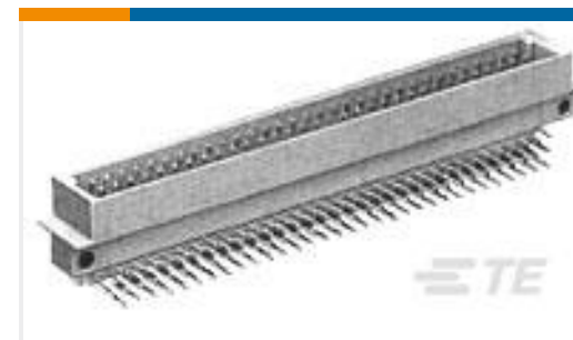
TE 产品编号216398-4 48P.IEC-C MALE CONN