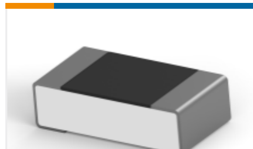
TE 产品编号2176368-8 RQ 0603 59K 0.1% 10PPM 1K RL