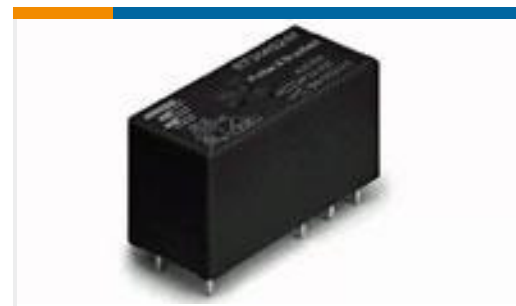
TE 产品编号3-1419108-9 RTD34024F