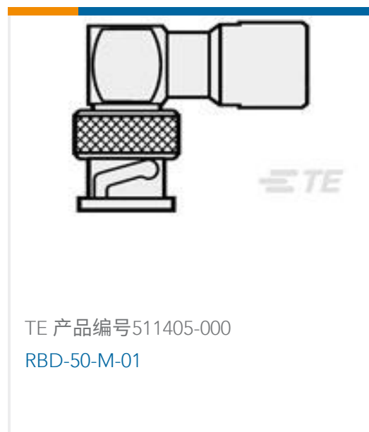
TE 产品编号511405-000 RBD-50-M-01