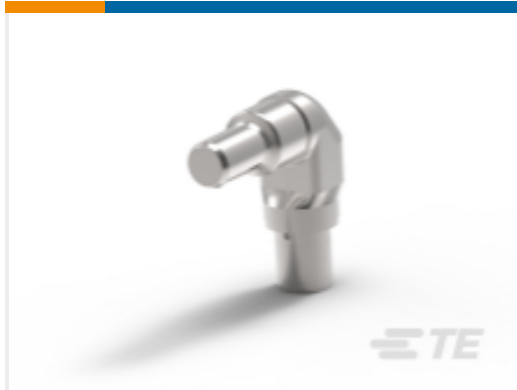
TE 产品编号ZPF000000000205378 CONTACT MALE ANG.90, CAL20, 120MM2 - FXP