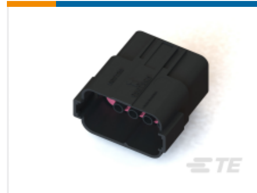
TE 产品编号ZPF000000000136485 RECEPTACLE MALE FOR 12 PINS, CAL1,6