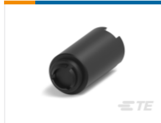
TE 产品编号YZ-KC-212751A-PY00 TOOL DISMOUNTING - FXP2