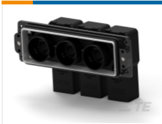
TE 产品编号ZPF000000000205376 RECEPTACLE FEMALE BULKHEAD - FXP