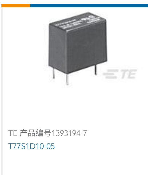
TE 产品编号 1393194-7 T77S1D10-05