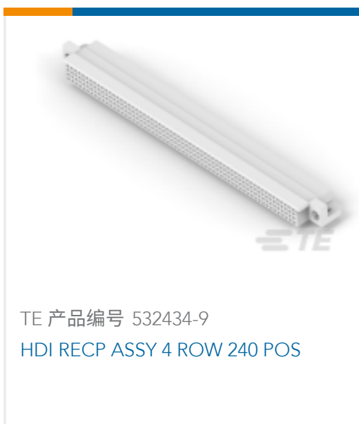
TE 产品编号 532434-9 HDI RECP ASSY 4 ROW 240 POS