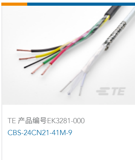
TE 产品编号 EK3281-000 CBS-24CN21-41M-9