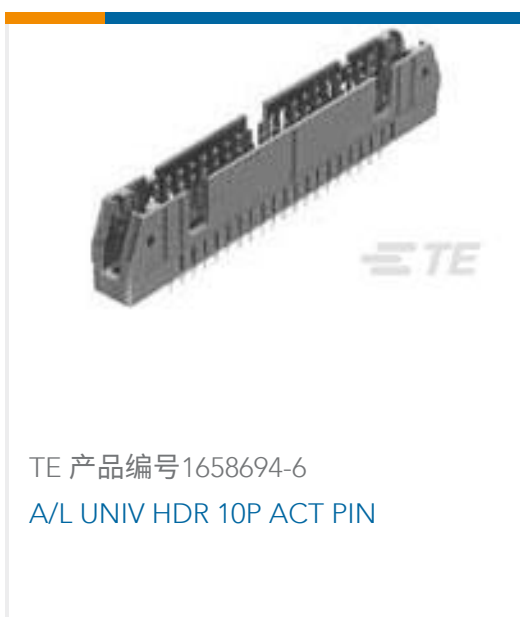
TE 产品编号 1658694-6 A/L UNIV HDR 10P ACT PIN