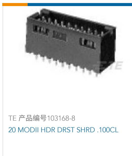
TE 产品编号 103168-8 20 MODII HDR DRST SHRD .100CL