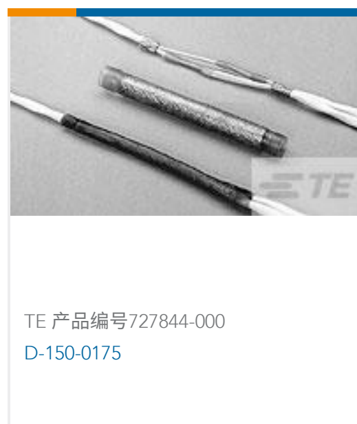
TE 产品编号 727844-000 D-150-0175