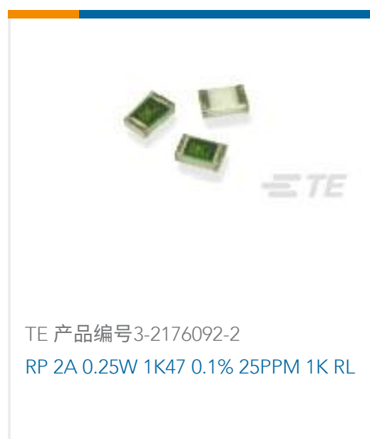
TE 产品编号 3-2176092-2 RP 2A 0.25W 1K47 0.1% 25PPM 1K RL