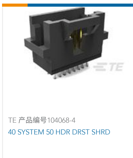
TE 产品编号 104068-4 40 SYSTEM 50 HDR DRST SHRD