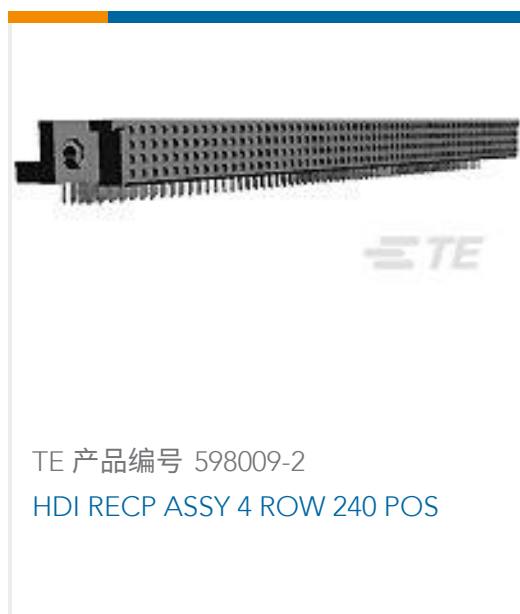
TE 产品编号 598009-2 HDI RECP ASSY 4 ROW 240 POS