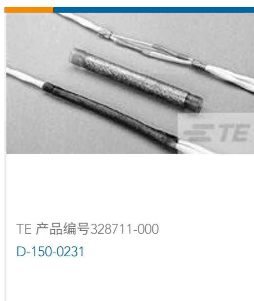
TE 产品编号 328711-000 D-150-0231