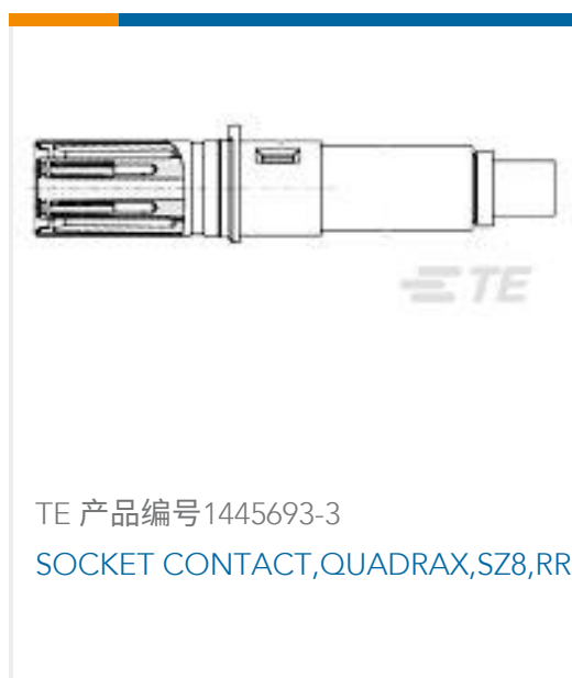
TE 产品编号 1445693-3 SOCKET CONTACT, QUADRAX, SZ8, RR