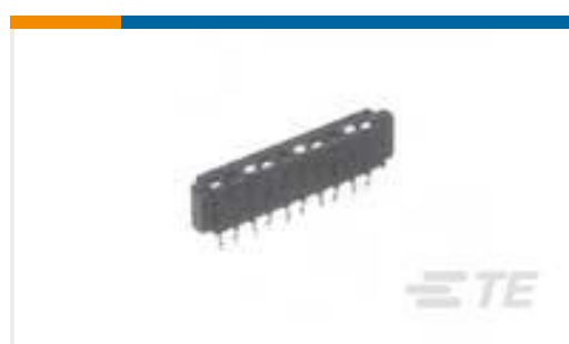
TE 产品编号5-520315-9 TRIOMATE ASSY V 9P L=3.556LDFR