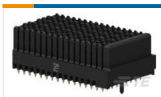
TE 产品编号1410142-1 MULTIGIG RT T2 .8" BP FULL RGH