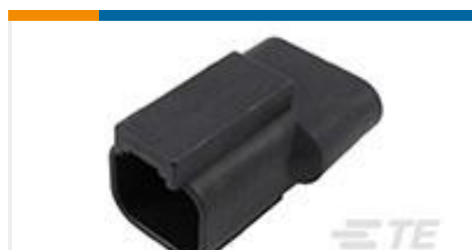
TE 产品编号DT04-2P-RT01 REC, 2P, BLK, 600V, 1.28V, 4A DIODE, NI