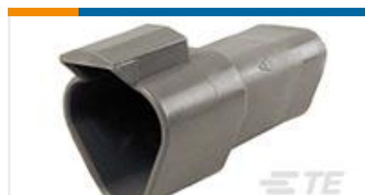
TE 产品编号DT04-3P-C015 REC, 3P, GRY, E