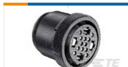
TE 产品编号207485-1 CPC PLUG ASSEMBLY SIZE 23-16