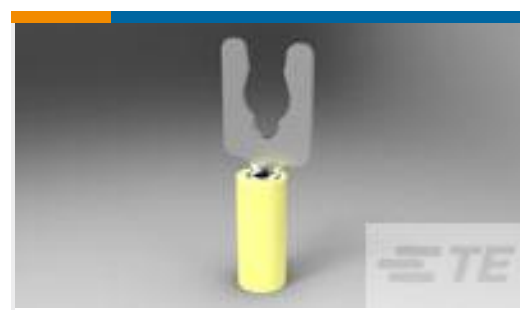
TE 产品编号52941-1 TERMINAL,PIDG SPR SPD 12-10 6