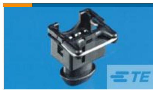
TE 产品编号282683-1 SPLASH PR.ASSY W.SEC.LOCK2W TY