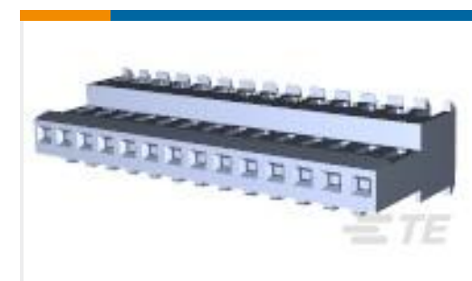
TE 产品编号4-640620-4 14P MTA100 CONN ASSY F/T RED