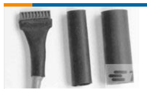
TE 产品编号105035-000 DWP-125-1/4-0-1.5IN