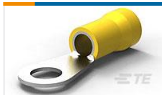
TE 产品编号52266-4 TERMINAL R PG 4 3/8