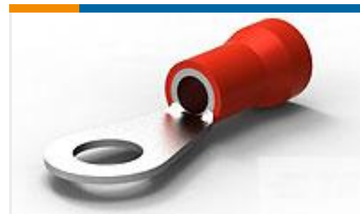
TE 产品编号52291-4 TERMINAL R PG 8 5/16