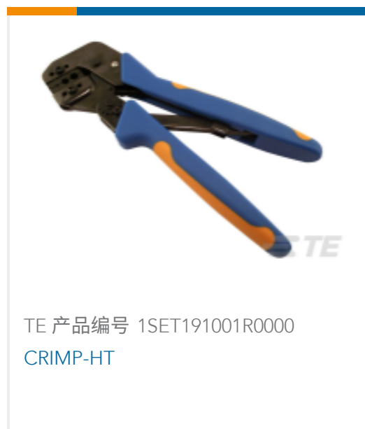
TE 产品编号 1SET191001R0000 CRIMP-HT