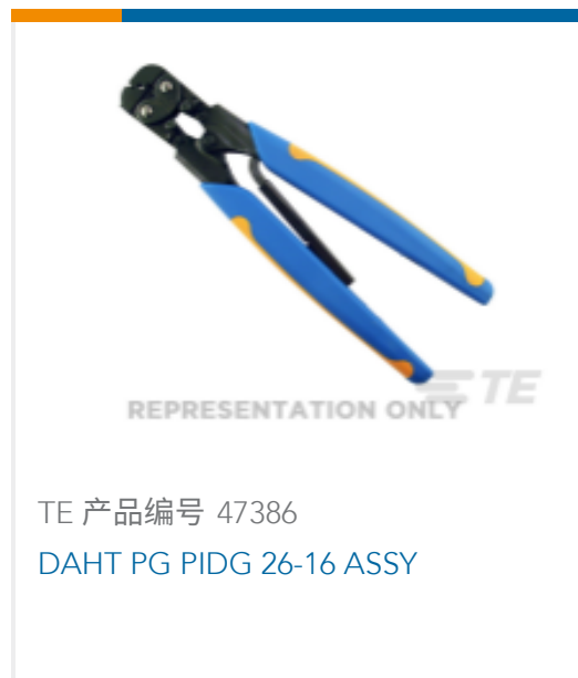
TE 产品编号 47386 DAHT PG PIDG 26-16 ASSY