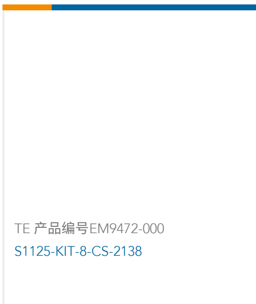
TE 产品编号EM9472-000 S1125-KIT-8-CS-2138