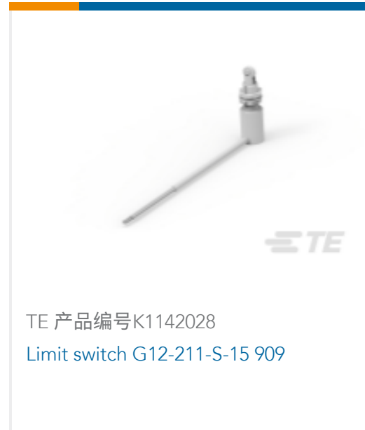
TE 产品编号K1142028 Limit switch G12-211-S-15 909