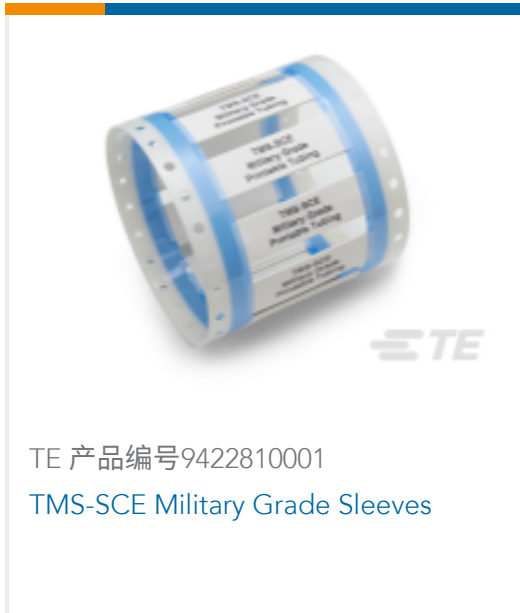
TE 产品编号9422810001 TMS-SCE Military Grade Sleeves