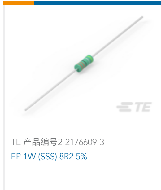
TE 产品编号2-2176609-3 EP 1W (SSS) 8R2 5%