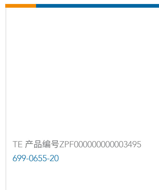
TE 产品编号ZPF0000000000003495 699-0655-20