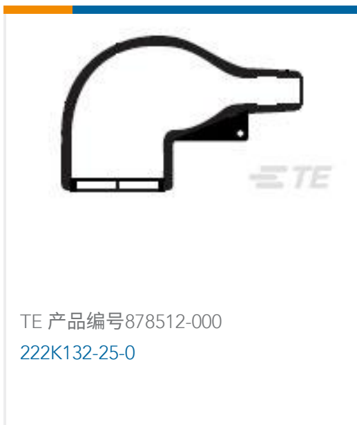
TE 产品编号878512-000 222K132-25-0