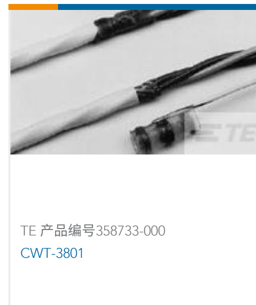
TE 产品编号358733-000 CWT-3801