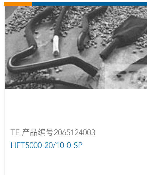
TE 产品编号2065124003 HFT5000-20/10-0-SP