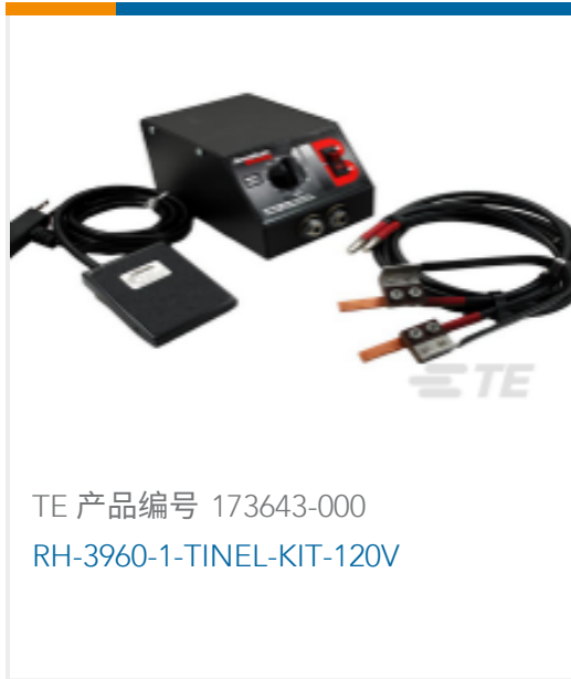
TE 产品编号 173643-000 RH-3960-1-TINEL-KIT-120V