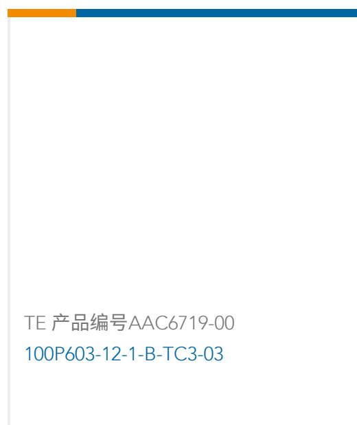
TE 产品编号AAC6719-00 100P603-12-1-B-TC3-03