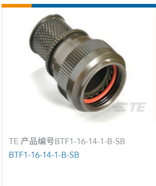
TE 产品编号BTF1-16-14-1-B-SB BTF1-16-14-1-B-SB