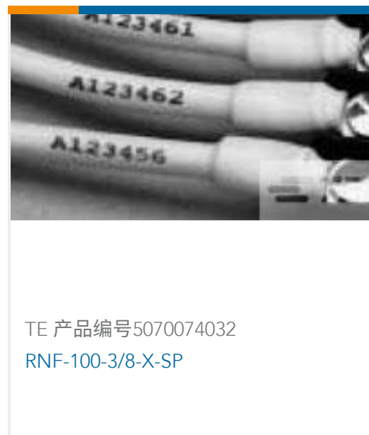
TE 产品编号5070074032 RNF-100-3/8-X-SP