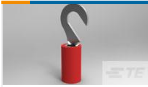
TE 产品编号32456 PIDG HK 22-16 COMM 22-18 MIL 8