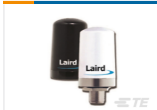
TE 产品编号TRAB24-49003P OMNI,Ph,2400/4900MHz BK,3 dBi, 60W,