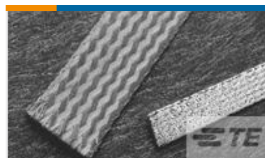
TE 产品编号125589-000 HV-BRAID-8-1520