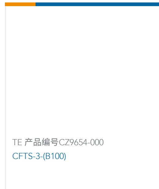
TE 产品编号CZ9654-000 CFTS-3-(B100)