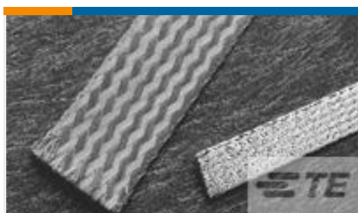
TE 产品编号638449-000 HV-BRAID-6-1520