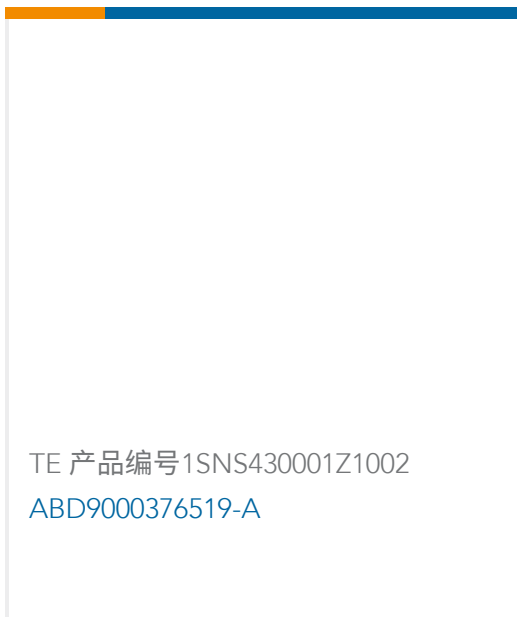
TE 产品编号1SNS430001Z1002 ABD9000376519-A