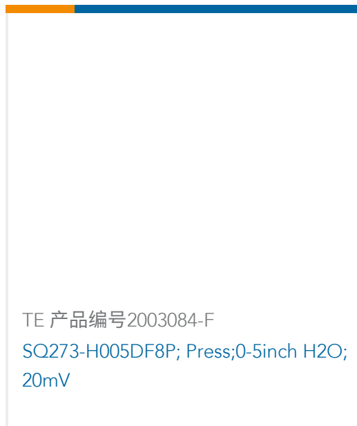
TE 产品编号2003084-F SQ273-H005DF8P; Press;0.5inch H2O; 20mV