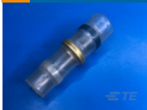
TE 产品编号D18609-000 B-155-07-F