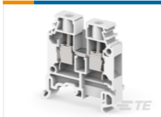
TE 产品编号1SNA115260R0300 M6/8.1