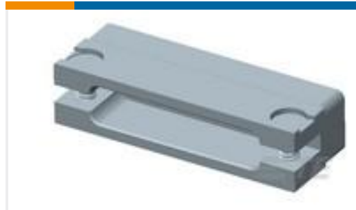
TE 产品编号492897-000 CHA-0276