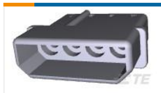
TE 产品编号1-480426-9 04P CMNL CAP HSG F/H BLK