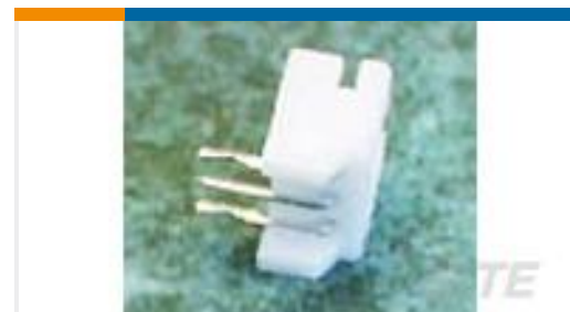
TE 产品编号440055-3 2.0MM,HDR,3POS,R/A