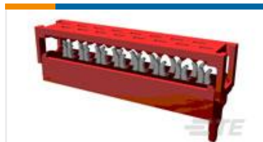
TE 产品编号8-215083-2 MICRO-MATCH MOW.12P