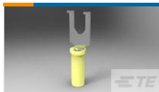
TE 产品编号52369-1 TERMINAL,PIDG SPD FLG 26-22 4