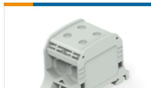
TE 产品编号1SNF516111R0000 CBS50-4P