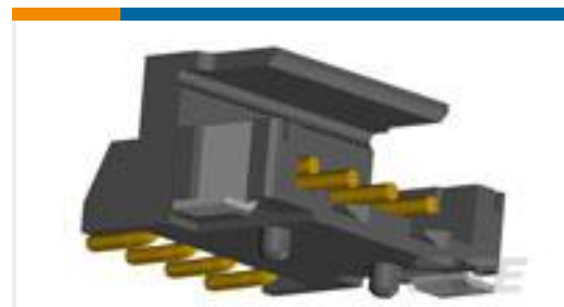
TE 产品编号292173-6 CT BOX HDR H SMT 6P O/TAPE BLA