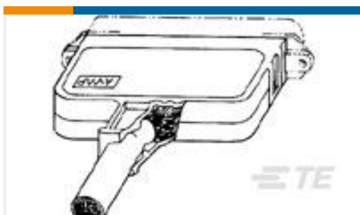
TE 产品编号2-552008-1 KIT, COVER, 180, 50 POS