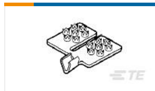
TE 产品编号53644-2 TERMINAL,TERMI-FOIL 12-10