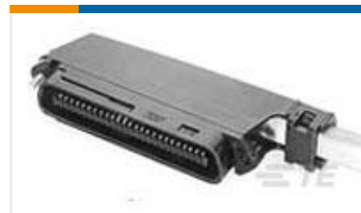
TE 产品编号1-5229913-1 KIT, RCPT, 50 POS, B SLOT