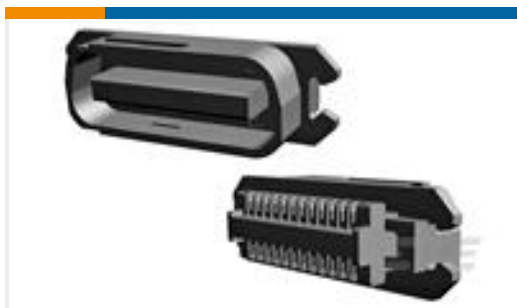
TE 产品编号552032-1 ASSY, PLUG, 50 POS, B SLOT