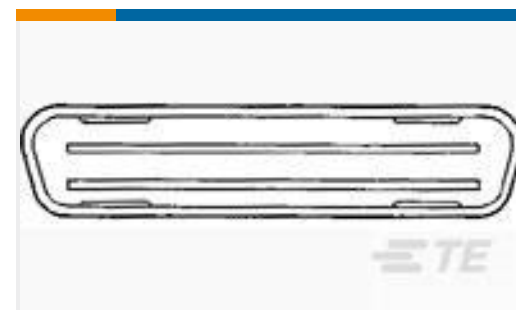
TE 产品编号229968-1 COVER,DUST,PLUG,BLUE,CHAMP