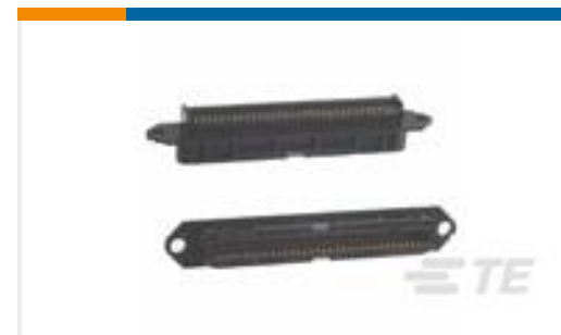
TE 产品编号552315-1 ASSY, RCPT, 64 POS, B SLOT