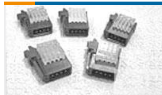
TE 产品编号1473562-8 RITS CONN. PLUG ASSY 8P YELLOW