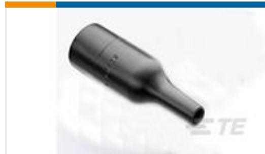
TE 产品编号CV7362-000 202K142-25L-0