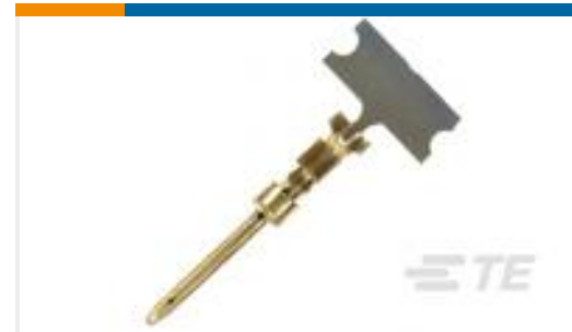
TE 产品编号66506-8 PIN CONTACT, 20 DF