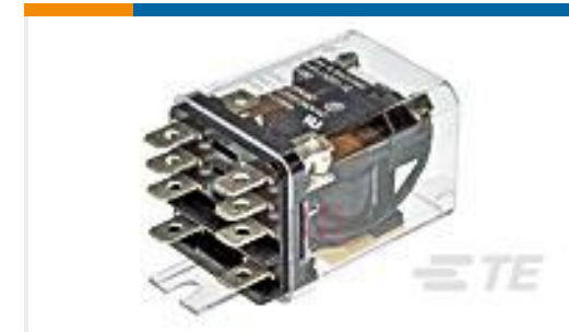
TE 产品编号7-1393114-7 KUHP-11D51-12=KU