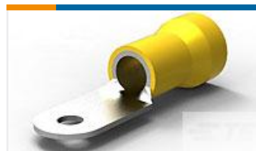
TE 产品编号52043 TERMINAL,R PG 4 10