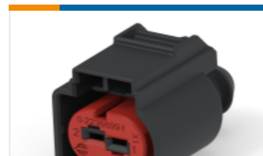
TE 产品编号2-2236706-3 2-POS. SEALED 2.8MM USCAR CLEAN BODY FOR