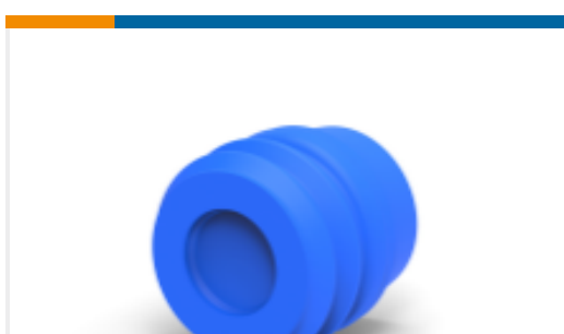
TE 产品编号2289241-1 WS-25-001, SEAL, BLU, 8.17-9.66, DTSK