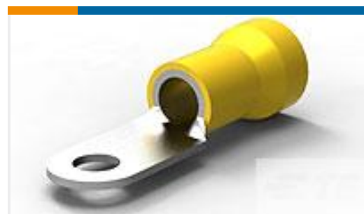
TE 产品编号52043-3 TERMINAL R PG 4 1/4