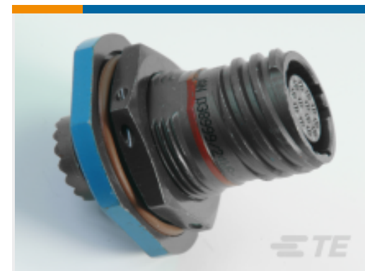
TE 产品编号YDTS24W17-26SNV001 RECP ASSY