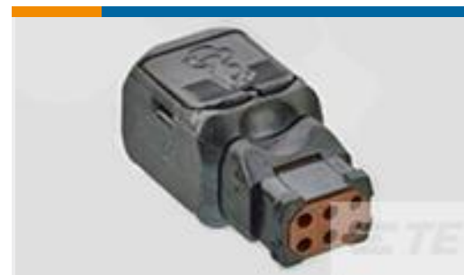
TE 产品编号D369-R66-NS0 369 6 WAY REC, NO CONTACTS, SKT