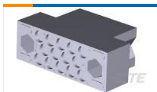
TE 产品编号201298-1 FEMALE BLOCK 14 PL