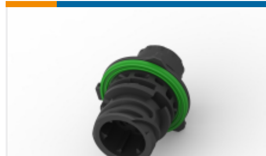
TE 产品编号1718230-3 1,5MM PIN HSG 5-7 POS ASSY