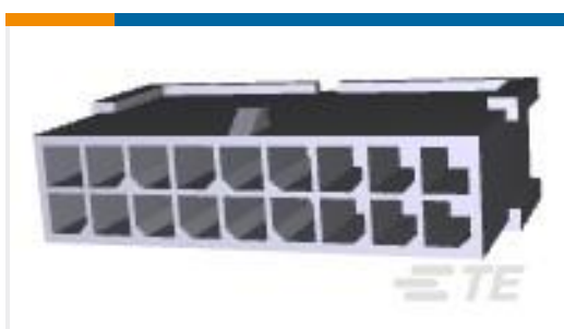
TE 产品编号1-794616-8 FREE HANG DBL ROW HSG 18 POS