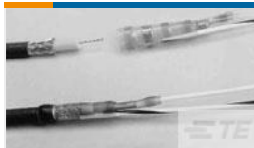
TE 产品编号024278-000 D-181-3222-90/9