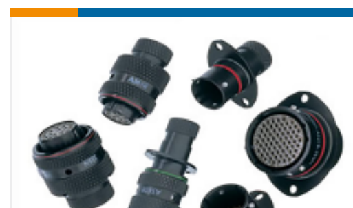
TE 产品编号ASL206-05PB-HE AUTOSPORT MICROLITE CONNECTOR PCB CONTACT