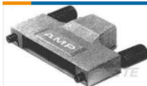
TE 产品编号5749081-1 100 50SR BSHLL KIT,M J-SCR