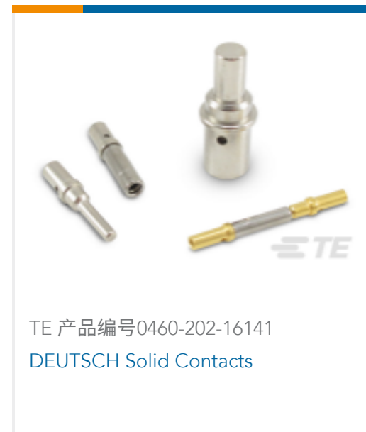
TE 产品编号0460-202-16141 DEUTSCH Solid Contacts