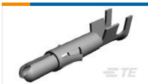
TE 产品编号350705-1 UMNL SPLIT PIN 20-14 PTPBR L/P