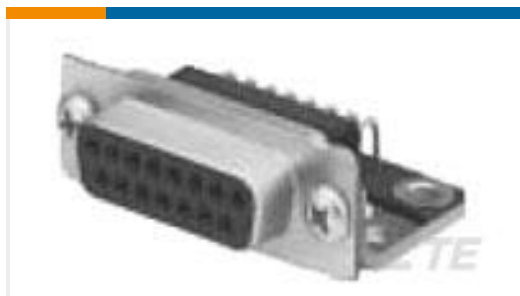
TE 产品编号5205858-1 25 RCPT RA/MS STD