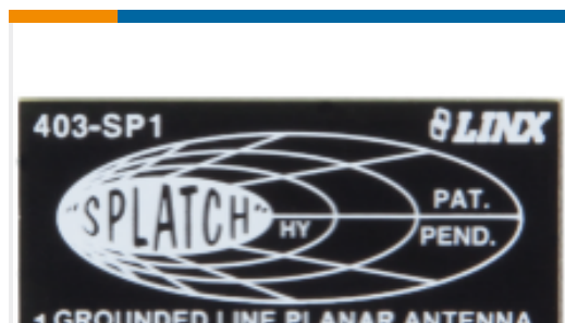
TE 产品编号ANT-403-SP Antenna SP PCB RPC 403MHz SMT