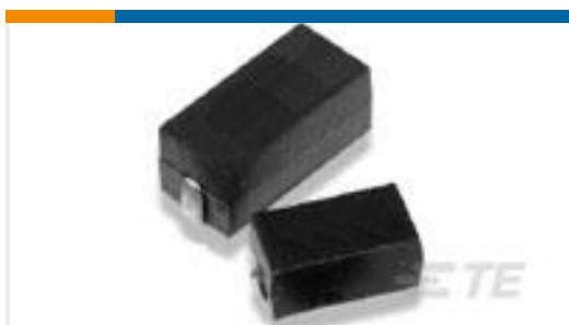
TE 产品编号2-1676966-7 SMW2 1R2 5%