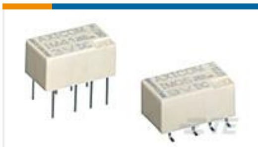
TE 产品编号2-1462039-6 IM21GR=IM RELAY 50mW 3V