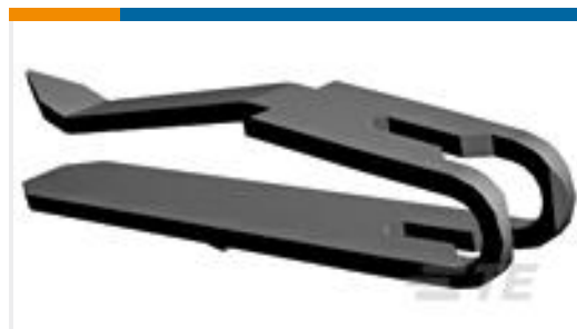
TE 产品编号640636-3 MTA100 V-SLOT TERM LP #22