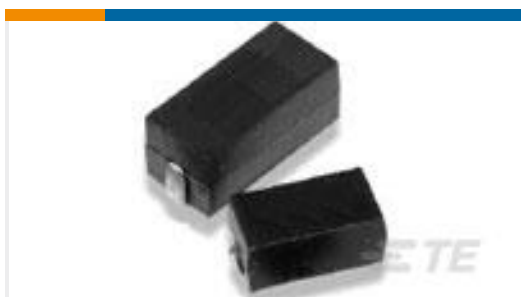
TE 产品编号3-1879021-5 SMW3 2R7 5%