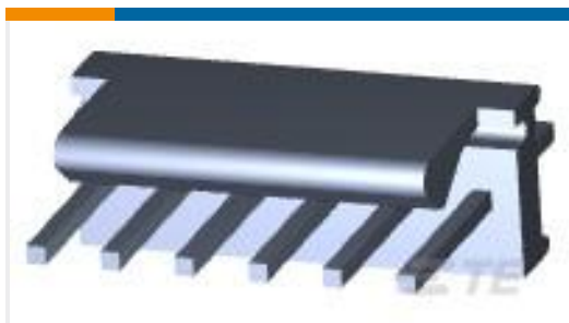
TE 产品编号3-641126-6 06P MTA100 HDR ASY FL/STR LF