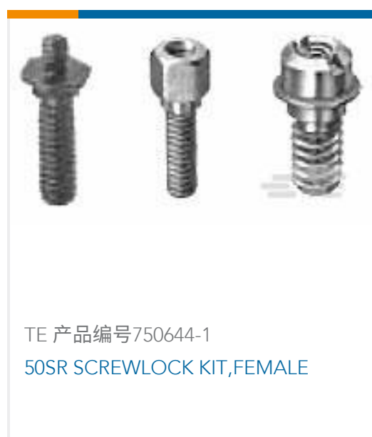
TE 产品编号750644-1 50SR SCREWLOCK KIT, FEMALE