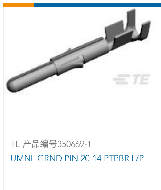
TE 产品编号350669-1 UMNL GRND PIN 20-14 PTPBR L/P