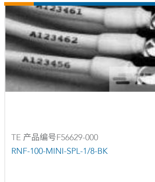
TE 产品编号F56629-000 RNF-100-MINI-SPL-1/8-BK