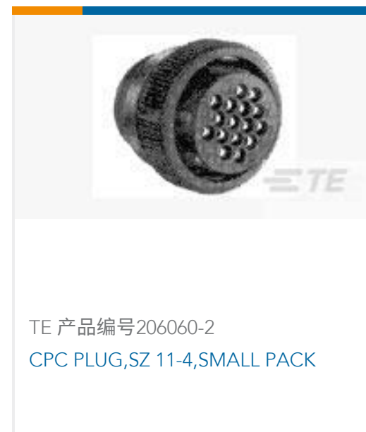
TE 产品编号206060-2 CPC PLUG, SZ 11-4, SMALL PACK