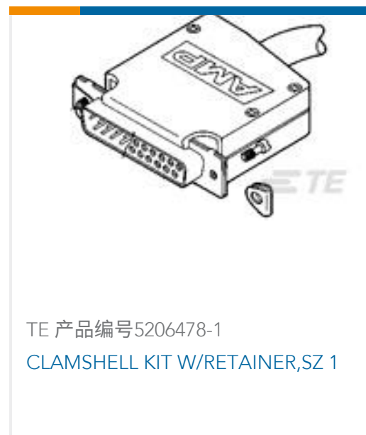
TE 产品编号5206478-1 CLAMSHELL KIT W/RETAINER, SZ 1