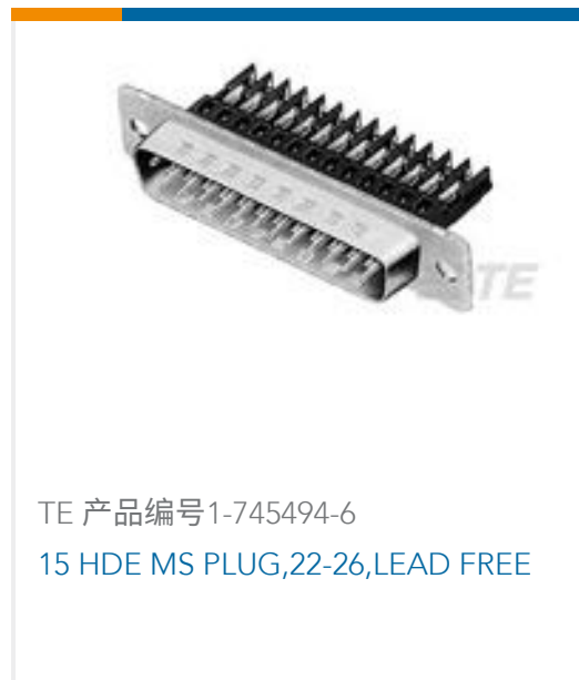
TE 产品编号1-745494-6 15 HDE MS PLUG,22-26,LEAD FREE