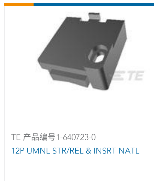
TE 产品编号1-640723-0 12P UMNL STR/REL & INSRT NATL