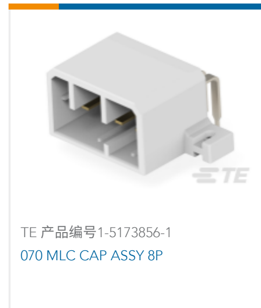
TE 产品编号1-5173856-1 070 MLC CAP ASSY 8P