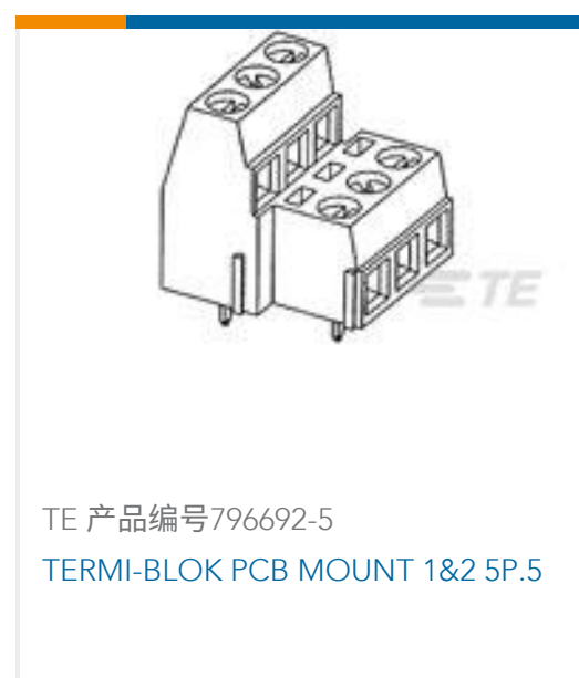
TE 产品编号796692-5 TERMI-BLOK PCB MOUNT 1&2 5P.5