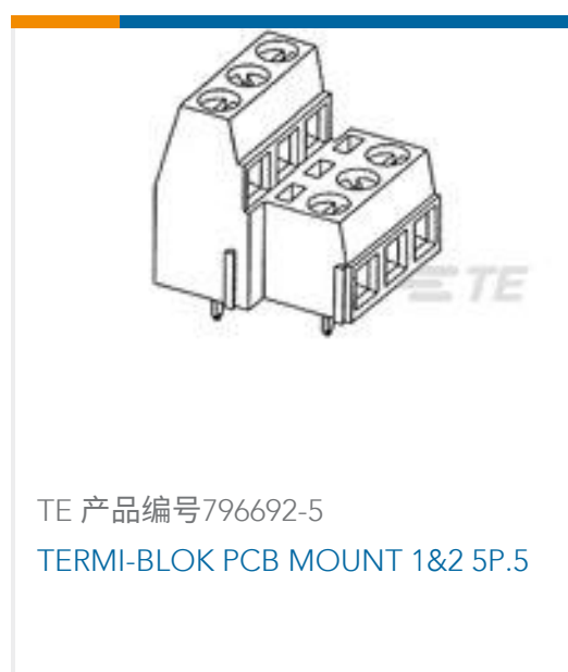
TE 产品编号796692-5 TERMI-BLOK PCB MOUNT 1&2 5P.5