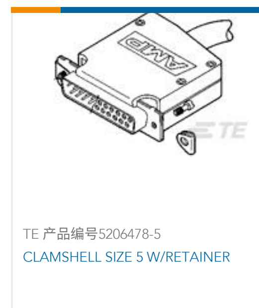
TE 产品编号5206478-5 CLAMSHELL SIZE 5 W/RETAINER