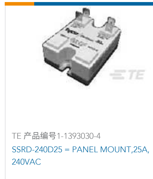
TE 产品编号1-1393030-4 SSRD-240D25 = PANEL MOUNT,25A, 240VAC