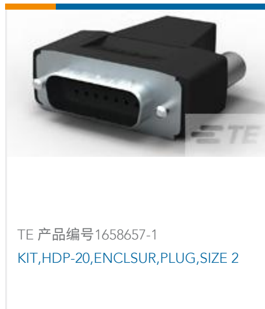
TE 产品编号1658657-1 KIT,HDP-20,ENCLSUR,PLUG,SIZE 2