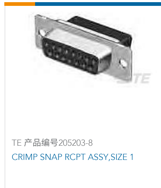
TE 产品编号205203-8 CRIMP SNAP RCPT ASSY,SIZE 1