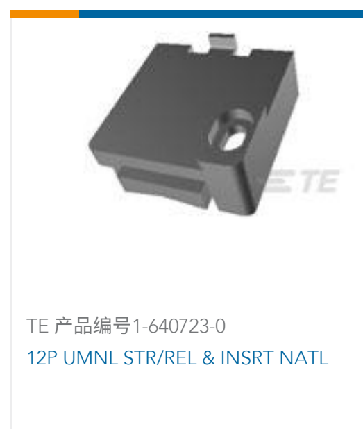
TE 产品编号1-640723-0 12P UMNL STR/REL & INSRT NATL