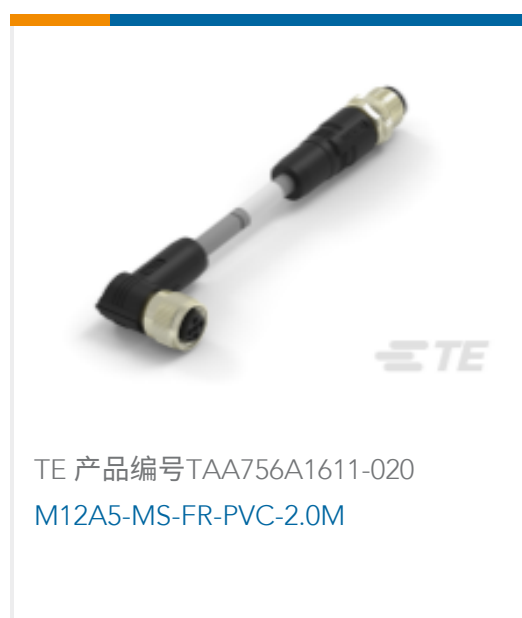
TE 产品编号TAA756A1611-020 M12A5-MS-FR-PVC-2.0M