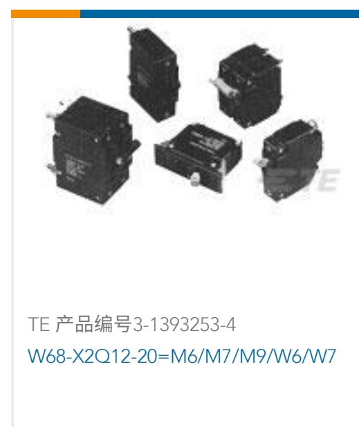
TE 产品编号3-1393253-4 W68-X2Q12-20=M6/M7/M9/W6/W7