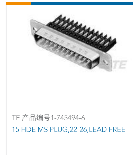
TE 产品编号1-745494-6 15 HDE MS PLUG,22-26,LEAD FREE