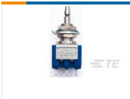
TE 产品编号1977740-2 MPS103FPC PSHBTN SPDT MMNTRY