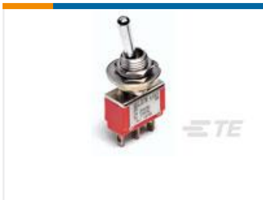
TE 产品编号1-1825137-5 A103SYCB04