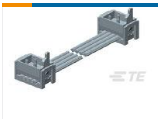
TE 产品编号2205067-3 CA MICRO-MATCH MOW-MOW 18POS