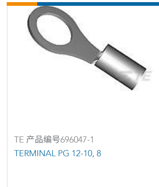
TE 产品编号696047-1 TERMINAL PG 12-10, 8