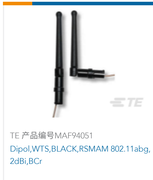
TE 产品编号MAF94051 Dipol,WTS,BLACK,RSMAM 802.11abg, 2dBi,BCr