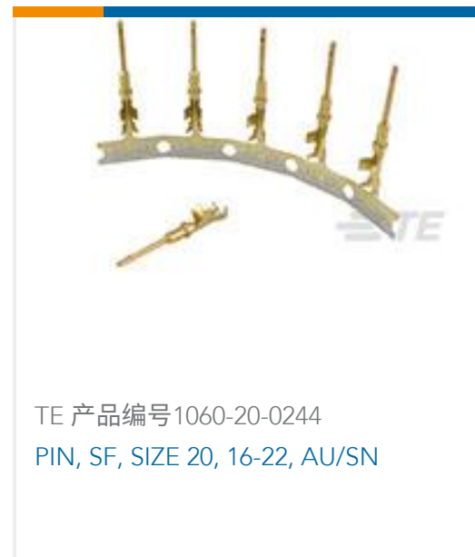
TE 产品编号1060-20-0244 PIN, SF, SIZE 20, 16-22, AU/SN