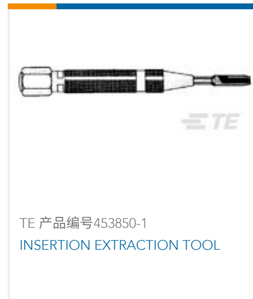
TE 产品编号453850-1 INSERTION EXTRACTION TOOL