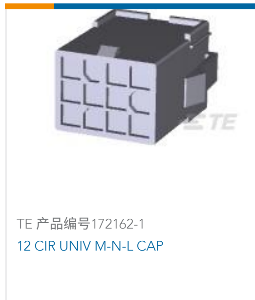
TE 产品编号172162-1 12 CIR UNIV M-N-L CAP