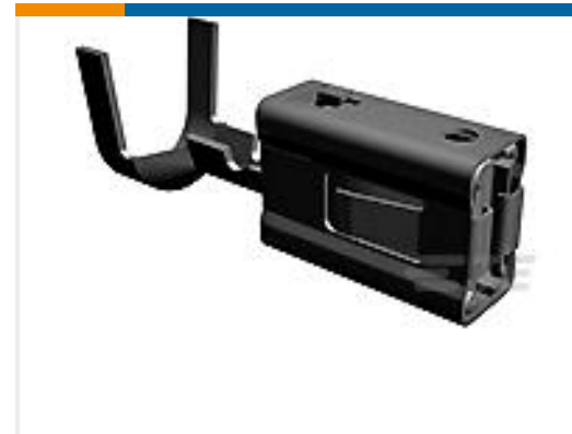
TE 产品编号1241412-3 AMP MCP 6.3/4.8K, CONTACT, SWS