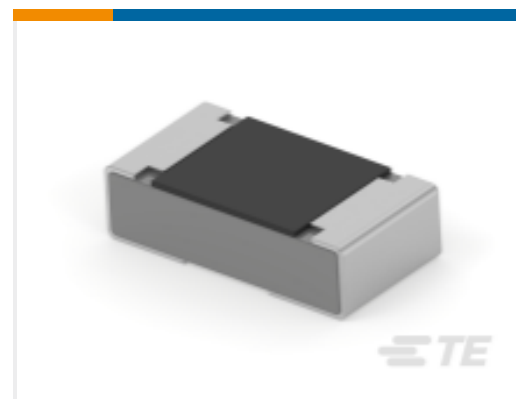
TE 产品编号3-2176479-1 RA73F 1J 105R 0.1% 5K RL