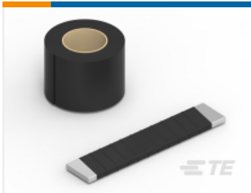
TE 产品编号CP4167-000 LVBT-1-R-01(B8)