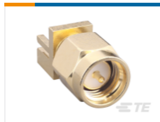
TE 产品编号L9000274-01 SMA Plug 50 Ohm .031 PCB Edge Mount