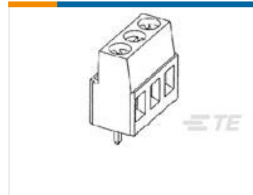
TE 产品编号282842-3 TERMI-BLOK PCB MOUNT 90 3P.