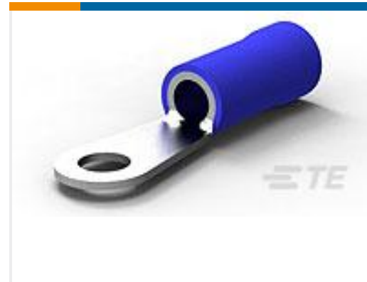
TE 产品编号52042-3 TERMINAL,R PG 6 1/4