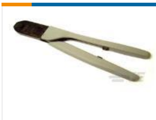
TE 产品编号91520-1 CCII AMPLIMITE HDP-22 PIN SKT 28-22 ASSY