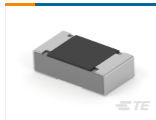
TE 产品编号1-2176479-5 RA73F 1J 71R5 0.1% 5K RL