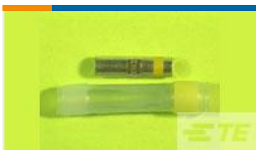
TE 产品编号 650075-000 D-436-37