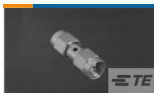
TE 产品编号1053635-1 2081 0000 02