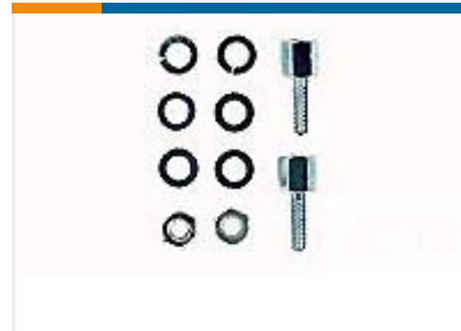
TE 产品编号5207952-1 KIT SCREWLOCK FEMALE