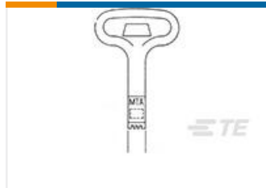
TE 产品编号59803-1 MAINTENANCE TOOL