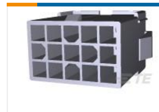
TE 产品编号172334-1 MINI UMNL CAP HOUSING 15P