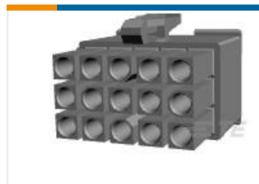
TE 产品编号172342-1 MINI UMNL PLUG HOUSING 15P