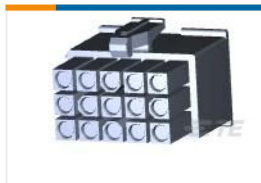
TE 产品编号172171-1 15 CIR UNIV M-N-L PLUG