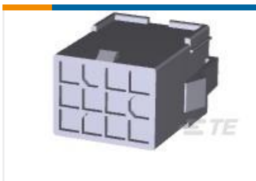
TE 产品编号172333-1 MINI UNIVERSAL M-N-L HOUSING